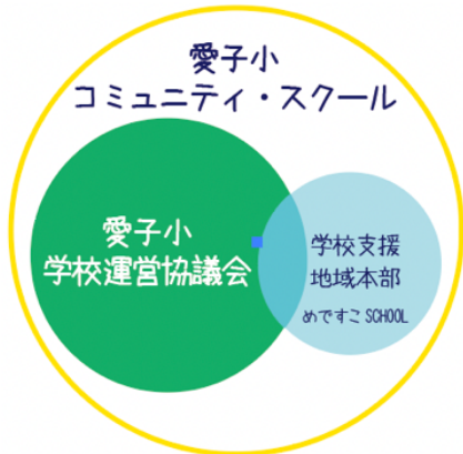
【愛子小コミュニティ・スクール概略図】

*「熟議」とは、学校職員や保護者、地域の方等、学校に関わる様々な立場の方が集まり、地域や学校の課題を共有し、互いの立場や役割への理解を深め、課題を解決していくために、自分に何ができるかを考えることです。「熟議」は、コミュニティ・スクールの活動の「要」です。